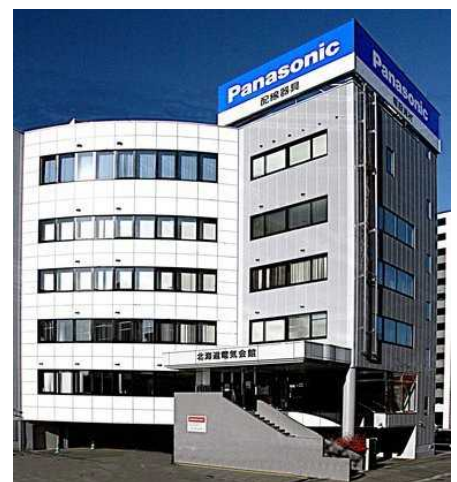
※受講票などはありませんので、1Fよりエレベータにて直接会場へお越しください